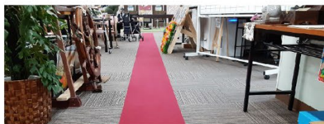
【アロハロード】一周60メートルある歩行訓練用の施設内ロード。