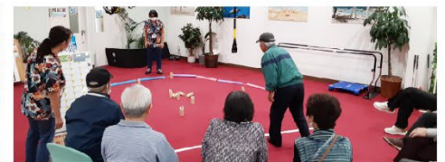
【モルック】フィンランド発祥のスポーツ。木の棒を倒して点数を競うゲーム。