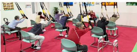
【TRX】可動域を広げる日常動作の負荷訓練に加え筋力低下を防ぐリハビリ器具。

専門的な器具を使ったリハビリも、パチンコや麻雀、カラオケなどの娯楽アイテムも、施設内での活動はすべてリハビリにつながっています。